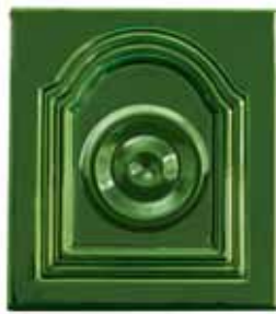
252 • Tisztító kapu