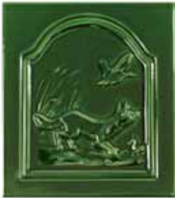
255 • Róka