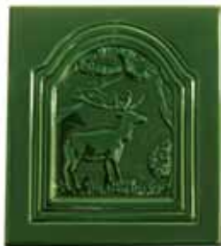
256 • Szarvas