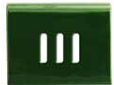
261 • Áttört talapzat