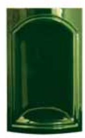
259 • Íves kapu sarok