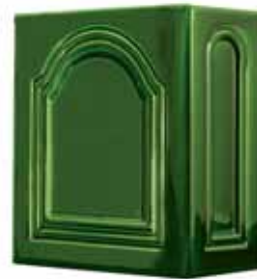
258 • Kapu sarok 1,5