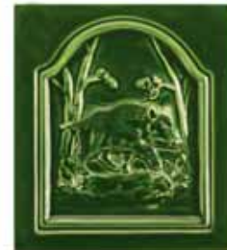
246 • Vaddisznó