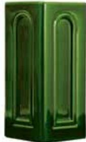
227 • Kapu sarok