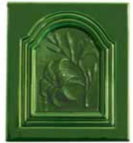
254 • Havasi gyopár