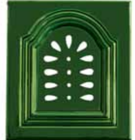
257 • Kapu áttört virág