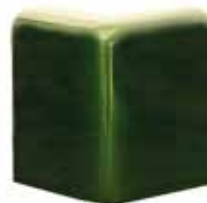
234 • Talapzat sarok