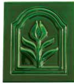
253 • Tulipán