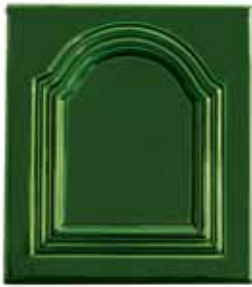
225 • Kapu