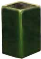
235 • Kályha cső 40