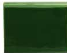
232 • Talapzat